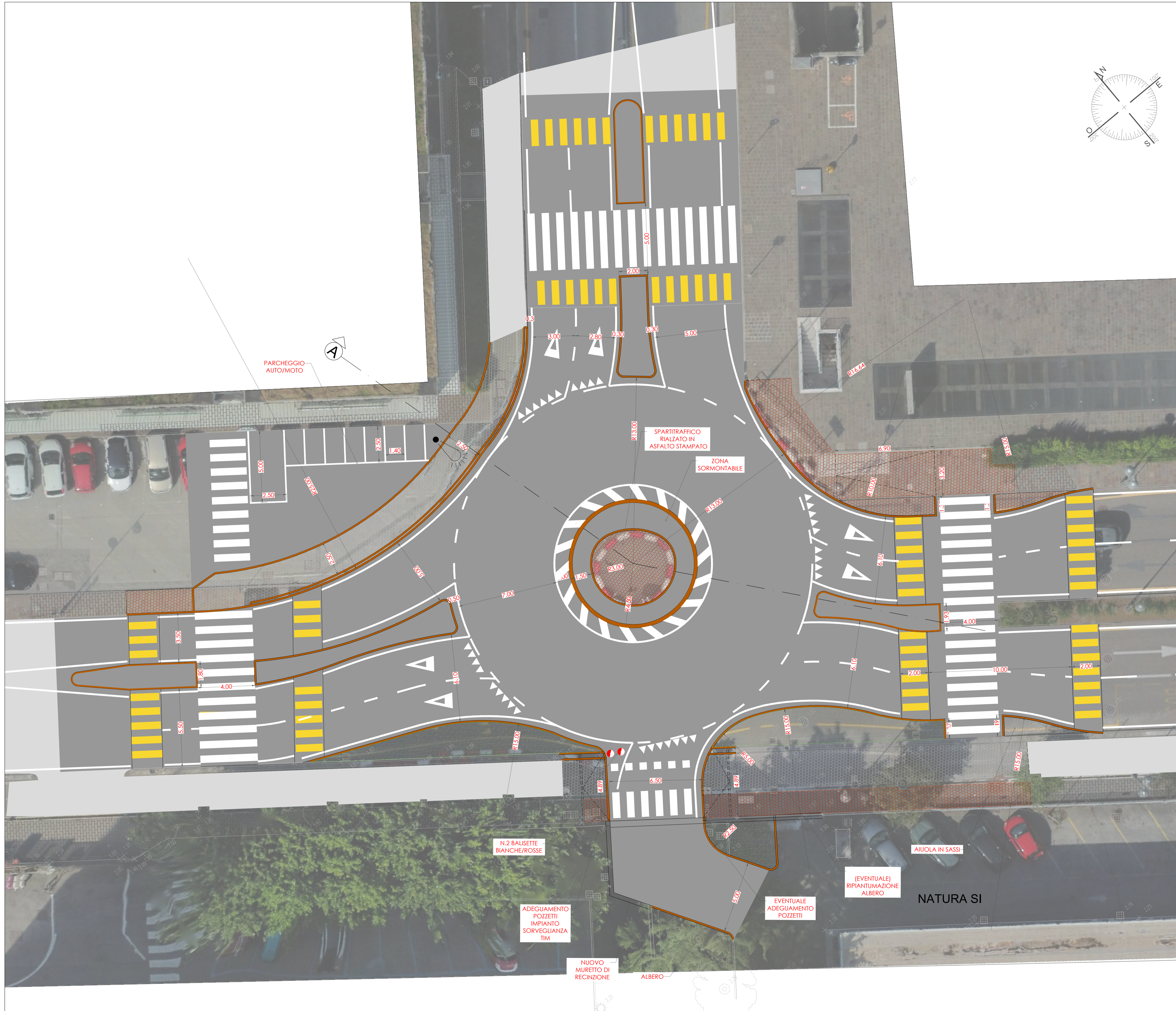
SEZIONE "A" SCALA 1:100