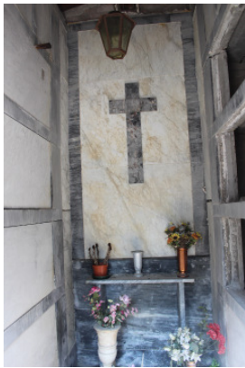
Interno del manufatto