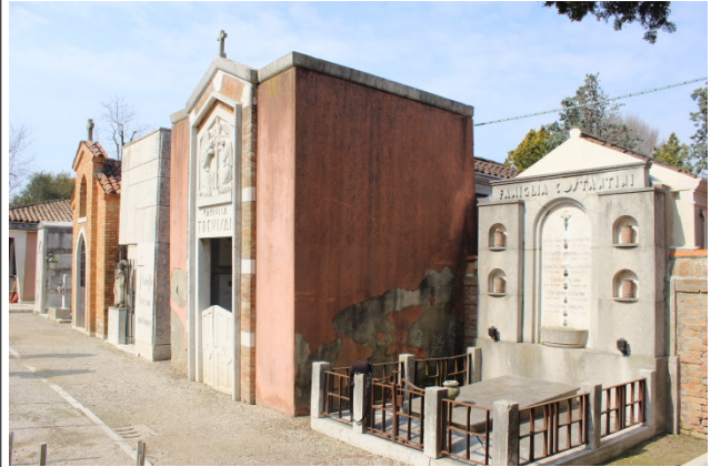
Fronte del manufatto e lato nord-est