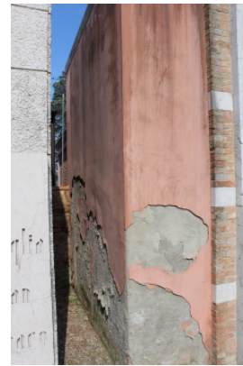
Particolare lato sud-ovest