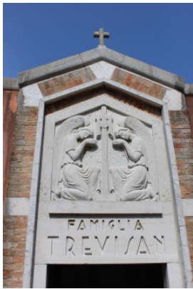
Particolare rilievo sulla facciata del manufatto