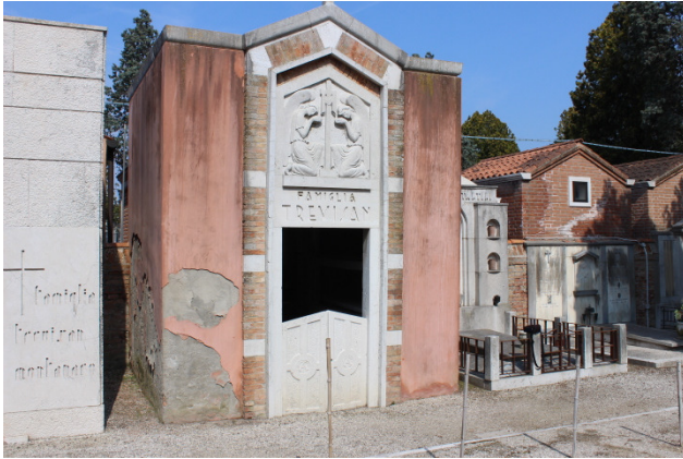
Fronte del manufatto