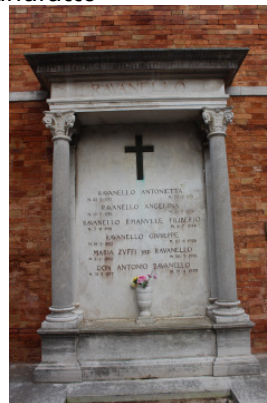
Fronte del manufatto