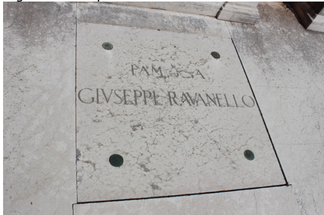
Sigillo della sepoltura