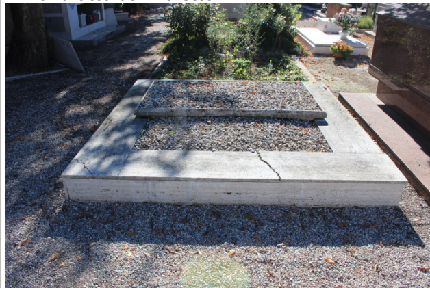
Il manufatto dal vialetto