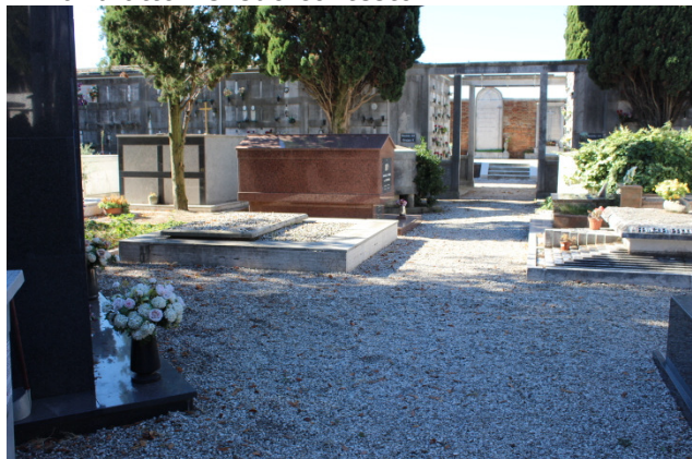
Il manufatto nel suo contesto