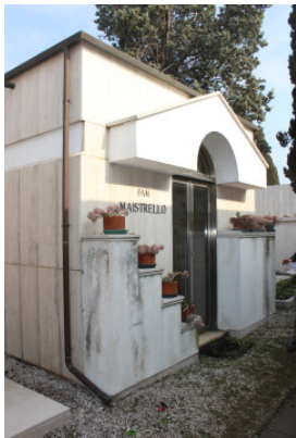
Fronte del manufatto