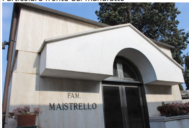
Particolare fronte del manufatto