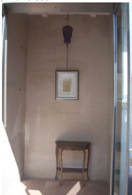
Interno del manufatto