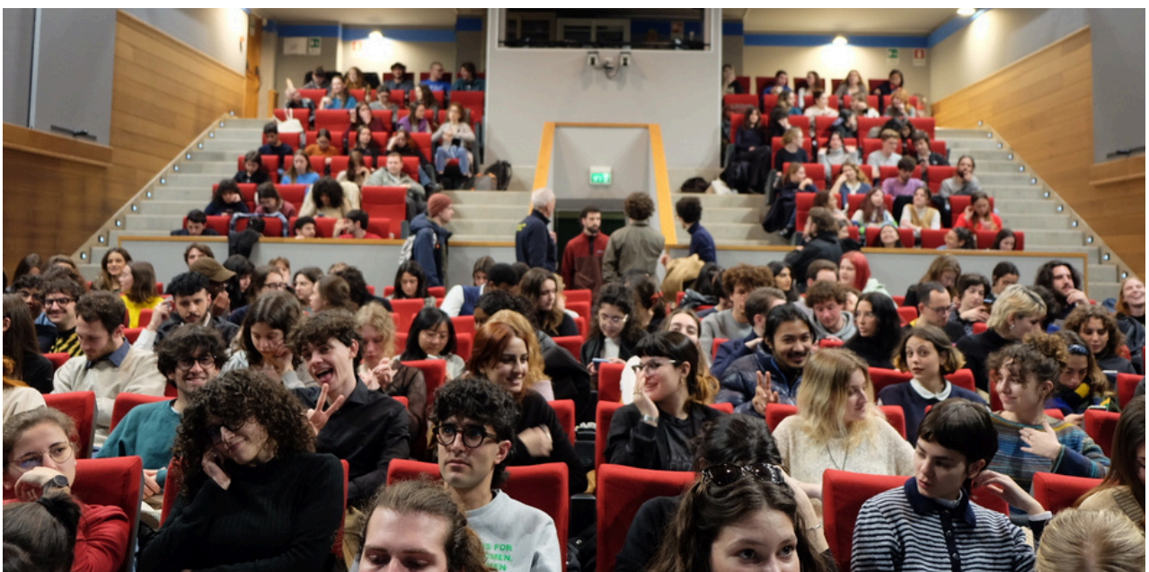
Rassegna "Proiezioni Urbane Vol I" di Quarta Parete al Teatro Ca' Foscari (Ve).

Quarta Parete Venezia è un collettivo cinematografico fondato nel 2018 a Venezia, con il supporto dell'associazione UdU - Venezia dell' Università Ca' Foscari . Creato dagli studenti per gli studenti, Quarta Parete nasce per riportare il Cinema al cinema, creare un trait d'union tra il fruitore e la pellicola, riscoprire il ruolo critico e attivo dello spettatore in una dimensione d'esperienza collettiva, all'interno della sala. Nel corso degli anni, Quarta Parete ha organizzato più di settanta proiezioni , coinvolgendo migliaia di persone nel territorio del veneziano, curando rassegne cinematografiche di corto e lungometraggi, sonorizzazioni di film dal vivo, dibattiti con ospiti, presentazioni di libri sul cinema e collaborando con molti festival, organizzando interviste e podcast con ospiti di caratura internazionale. La redazione, inoltre, oltre a scrivere di cinema, ottiene gli accrediti stampa ai festival più prestigiosi, avendo l'occasione di vedere film in anteprima da poter indicare per le rassegne che organizziamo. Quarta Parete è una realtà in espansione, sempre alla ricerca di nuovi talenti appassionati di cinema che vogliono trovare la loro strada nel mondo della cultura.