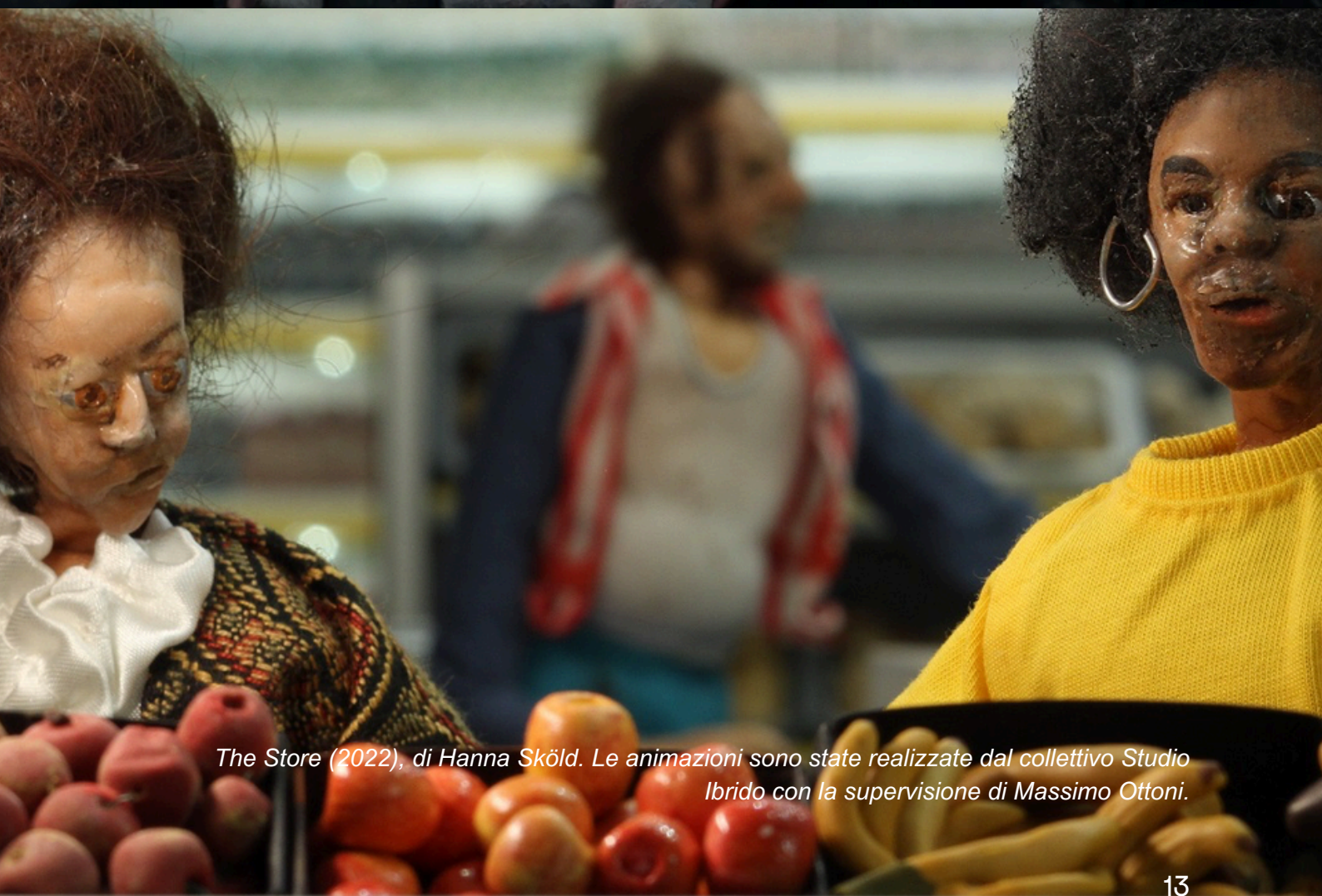
The Store (2022), di Hanna Sköld. Le animazioni sono state realizzate dal collettivo Studio Ibrido con la supervisione di Massimo Ottoni.