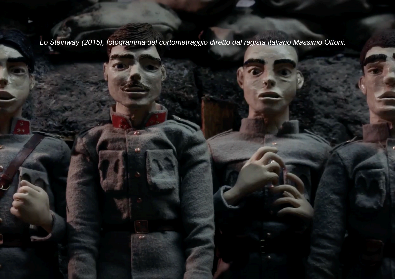
Lo Steinway (2015), fotogramma del cortometraggio diretto dal regista italiano Massimo Ottoni.