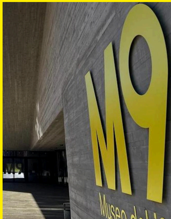
La sede principale del festival: M9 - Museo del '900 (Ve).

Il festival si terrà presso gli spazi di M9, Museo del Novecento , per tutta la sua durata. È stata scelta questa sede in quanto centro culturale nevralgico della città metropolitana di Venezia Mestre , nonché il museo che celebra il XX secolo, attraversato e raccontato proprio dall'arte cinematografica.