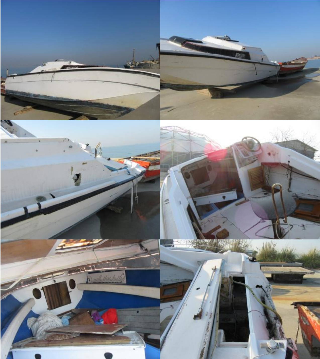
Scafo in vetroresina, lunghezza 6.00, larghezza 2.00, necessita di notevoli interventi di ripristino e allestimento