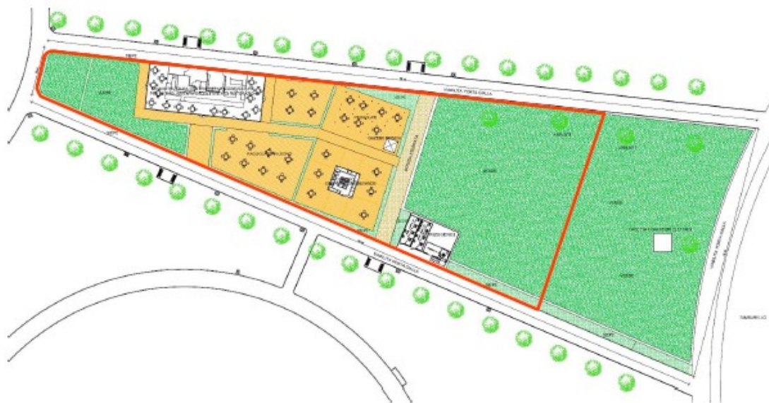
Planimetria con evidenziata in colore rosso l'area interessata

L'area oggetto dell'Avviso Pubblico ricade all'interno del Parco di San Giuliano Foglio 144 Particella 457.