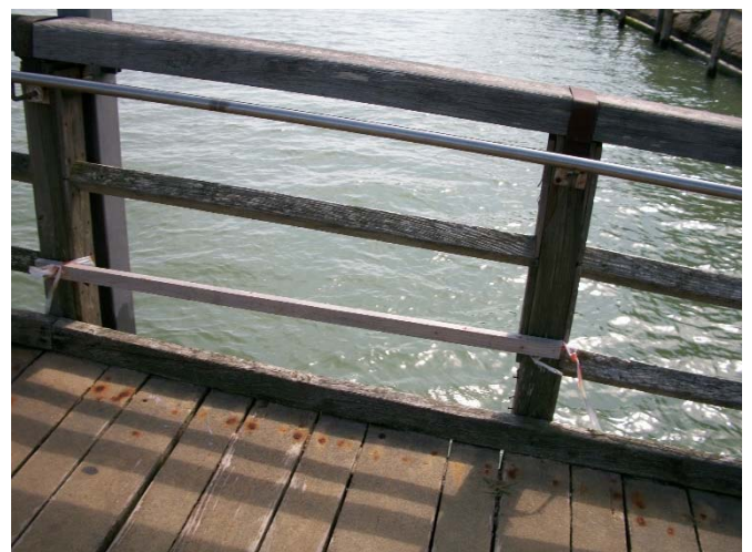
^ Particolare di dissesto del ponte. Tavolato ligneo e parapetto in stato di degrado

Per permettere l'esecuzione dell'intervento è stata emanata l'ordinanza n. 67/2016 che prevede la chiusura al traffico acqueo del canale sottostante e lo sgombero delle rive limitrofe dal 10 ottobre al 19 dicembre. In particolare, dalle ore 7 alle ore 19 è interdetta la navigazione, la sosta e l'approdo lungo le rive e nel canale Retro Mazzorbo per un raggio di circa 30 metri. Sono pertanto sospese le concessioni degli spazi acquei fino al termine dei lavori.