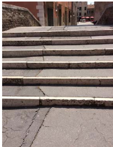
particolari del ponte prima dell'intervento