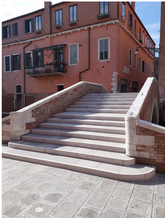
il ponte dopo l'intervento di sostituzione della pavimentazione

la scarnitura del sottofondo in calcestruzzo, successivamente si è proceduto con il lievo e l'accatastamento delle cordonate, è stato realizzato il sottofondo con malta a base di calce e sono state posate le cordonate e le lastre in trachite grigia a giunto unito, rispettando le quote del piano di calpestio attuale. I lavori hanno visto anche la manutenzione dei parapetti, dell'arco che presenta localizzati segni di deterioramento e il rifacimento dell'intonaco. Con l'occasione, sono stati riordinati i sottoservizi (acqua) e sono stati aggiunti quattro corrugati per il passaggio della fibra e l'eventuale passaggio di altri enti.