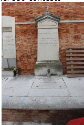
Il manufatto nel suo contesto