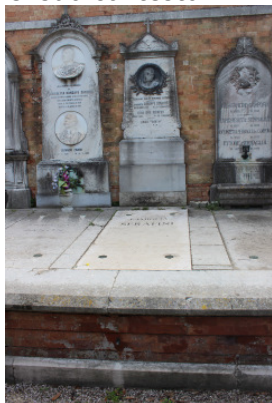
Il manufatto nel suo contesto