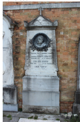
Fronte del manufatto