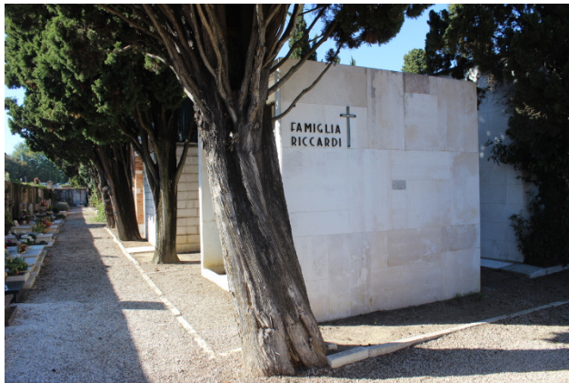
Vista laterale del manufatto