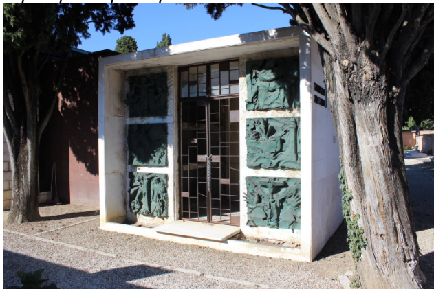
Il prospetto principale del manufatto