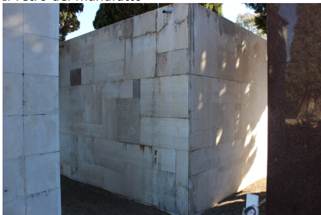
Il retro del manufatto