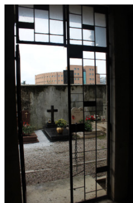
Particolare del serramento