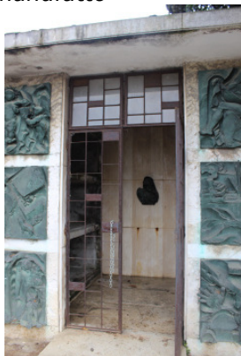
Ingresso del manufatto