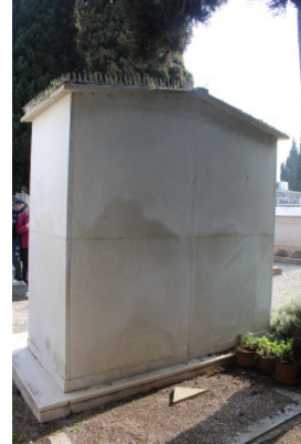
Retro del manufatto