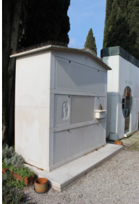
Fronte del manufatto