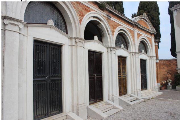
Le cappelle dell'Emiciclo