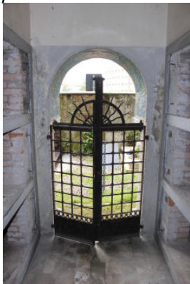
Particolare disposizione loculi