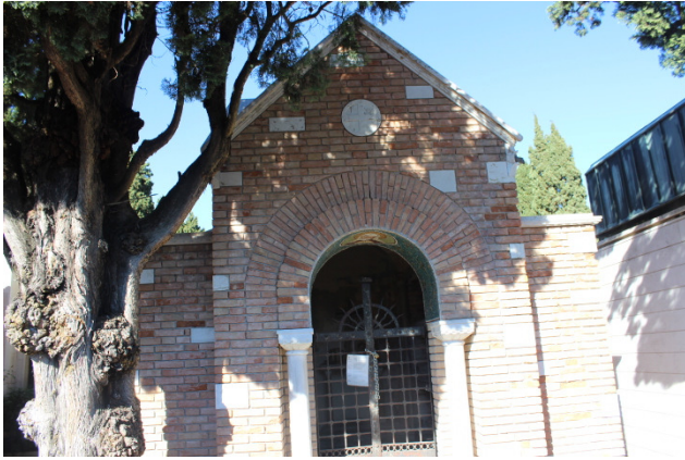
Il manufatto nel suo contesto